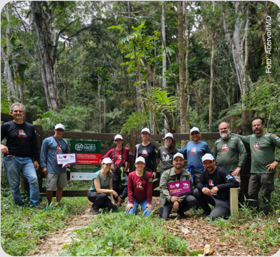
Visita do GAT do PAN das Aves da Mata Atlântica à Reserva Kaetés.