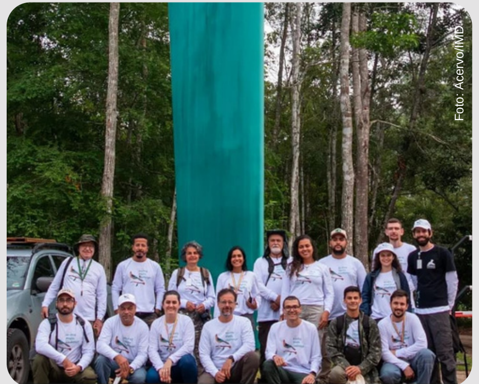
IMD e Reserva Natural Vale no 6º Birding Photo Challenge.

O Instituto Marcos Daniel (IMD) e a Reserva Natural Vale (RNV) organizaram a 6ª edição do Birding Photo Challenge, um concurso fotográfico onde apenas as fotos feitas durante o evento puderam concorrer ao prêmio. O concurso teve seletivas nos estados do Maranhão, Pará e Espírito Santo. A grande final foi na RNV, em Linhares - ES. O concurso é uma iniciativa que visa ampliar a conscientização sobre conservação ambiental e promover a observação de aves.