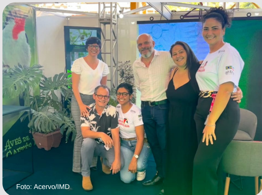
Equipe e parceiros prestigiando a feira Conexão Agro 2023.