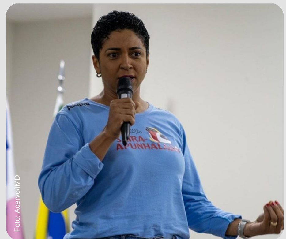
Mobilização do turismo em Santa Teresa, ES.

Em Novembro, a equipe do PCSA marcou presença no lançamento do "Selo Santa Teresa (1874), 150 anos da Imigração Italiana", evento que fez parte do Programa Santa Teresa 2024. O encontro, realizado no Senac, reuniu cerca de 180 pessoas, incluindo autoridades locais, líderes do turismo regional, empreendedores e nossa equipe. Foi uma oportunidade de apresentar o PCSA, destacando sua missão na conservação, e o potencial do ecoturismo para o desenvolvimento sustentável local. A participação do PCSA foi crucial para fortalecer a presença do IMD no contexto da conservação no Espírito Santo.