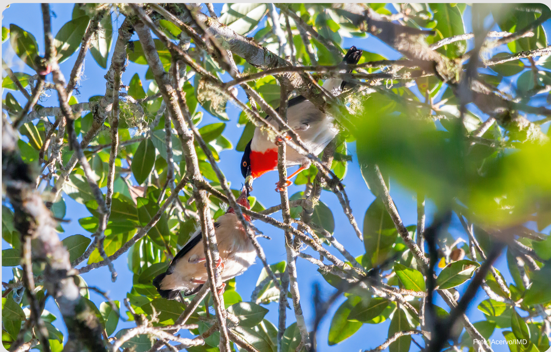
Saíra-apunhalada alimentando filhote na Reserva Kaetés.

No segundo semestre de 2023, foram encontrados dois ninhos da saíra-apunhalada, um na Mata de Caetés em Agosto que foi abandonado após o terceiro dia de incubação e outro em Santa Teresa no mês de Setembro, que foi predado por araçaris ( Pteroglossus aracari ). Após estes eventos não foram encontrados outros ninhos. Atualmente a população de saíras-apunhaladas conhecida é de 20 indivíduos, 15 na Mata de Caetés (Vargem Alta e Castelo) e 5 em Santa Teresa.