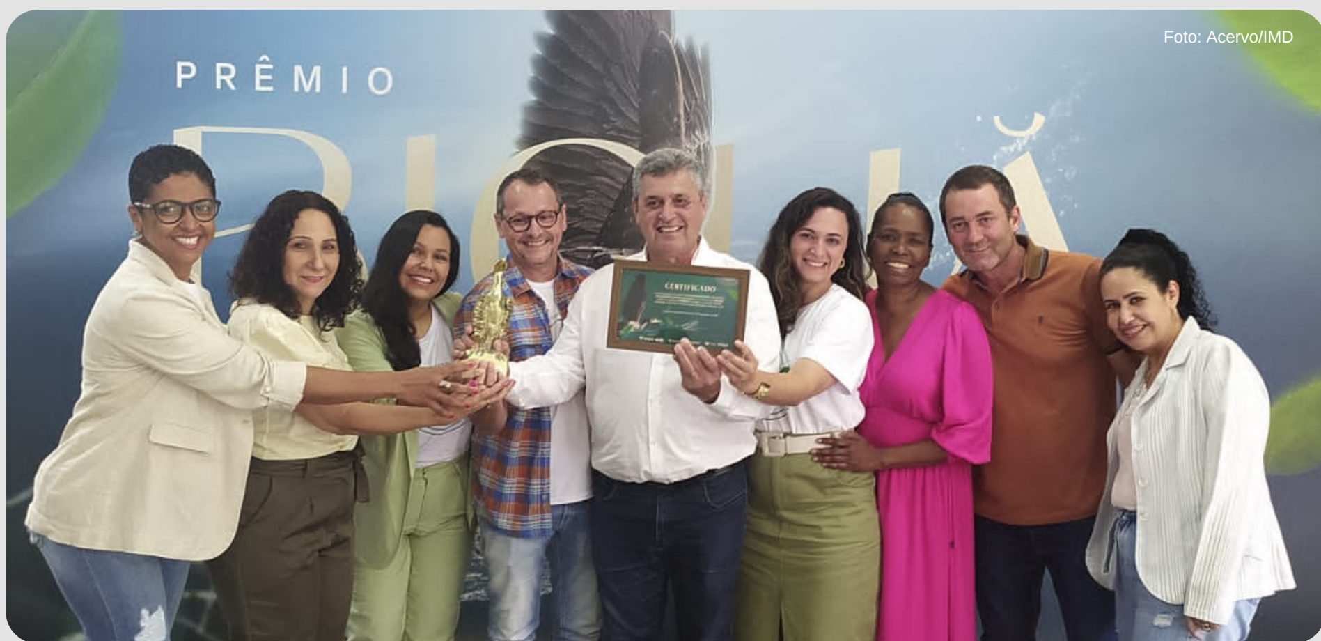
Grupo de Trabalho e representantes das instituições executoras do Ser Mata Atlântica recebendo o Prêmio Biguá de Sustentabilidade 2023.

Em 2023, o Programa Ser Mata Atlântica recebeu o Prêmio Biguá de Sustentabilidade da TV Gazeta (afiliada da Rede Globo local) por sua importante atuação na promoção da educação ambiental e conservação da biodiversidade na região de Vargem Alta, ES. Lançado em 2022, o programa alcançou resultados significativos em duas edições, incluindo a introdução da disciplina "Ecossistemas Vargem-altenses" na escola EMEBTI José Helvécio Altoé. Por isso, a escola se tornou a primeira escola de tempo integral do município. Além disso, capacitou 40 educadores ambientais locais e impactou diretamente cerca de 3 mil alunos das redes públicas municipal e estadual.