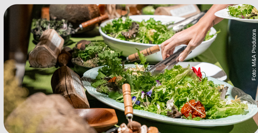
Pratos preparados pelo Cozinha Rústica com apoio de Adenilson Panzin