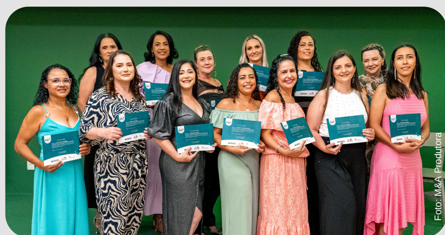
Formandas do II Ser Mata Atlântica.

Além da cerimônia de formatura, o evento foi marcado pelo buffet de comidas preparado pela equipe do Cozinha Rústica com ingredientes não convencionais da Mata Atlântica, como palmito pupunha, guariroba, indaiá, brejaúba, sobremesas com coco de palmeira-juçara e mel de uruçucapixaba. Foi uma celebração não só do sucesso dos educadores, mas também uma homenagem à riqueza e importância da biodiversidade local.